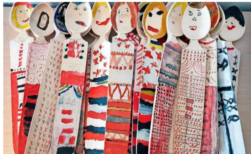
Knutselwerkjes van Oekraïense kinderen.