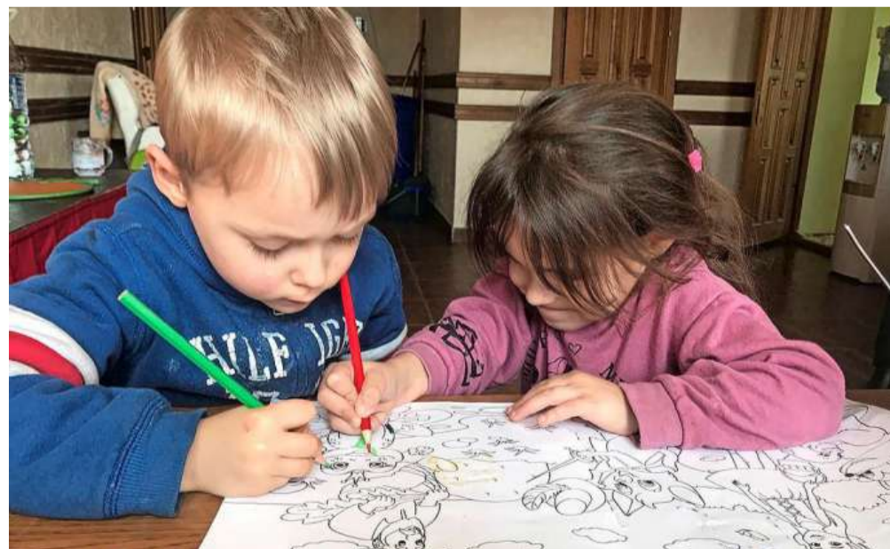
Kinderen kleuren in het opvangcentrum.

En de festiviteiten voor het 25-jarig jubileum? „We waren van plan om wat activiteiten te organiseren, ook voor de kinderen in de gebieden waarin wij werken. Maar er valt dit jaar niets te vieren.”