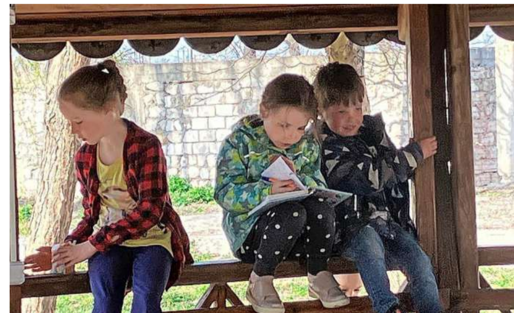
Oekraïense kinderen in het opvangcentrum in Moldavië